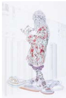
竹内 知 《図書館で虐待についての辞書を読む》