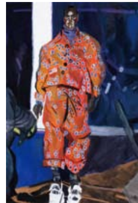
茶園 大暉 《ケンゾーの2017年のあきふゆ》